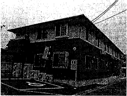
ウイングが完結して材提供施工を担った福岡県遠賀郡のグループホーム「月つき」

的なサービス体制の充実に注力している。ウイングR&D研究所を設立し、新技術の開発にも力を入れている。厳しい時代の到来を見据え、サービスの付加価値化を目指す動きがここにある。